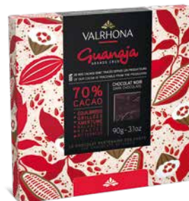
GUANAJA 70% REF. 47856 EAN : 3395328715727