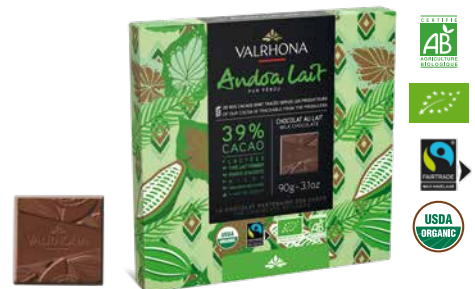
ANDOA LAIT 39% REF. 47857 EAN : 3395328715789