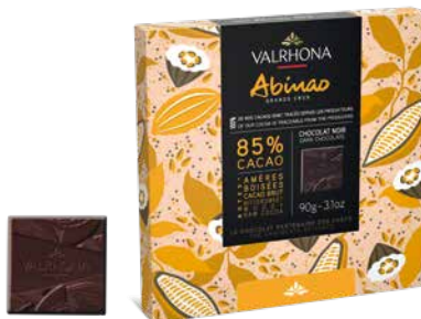
ABINAO 85% REF. 47854 EAN : 3395328715659

*Hors film plastique du coffret de regroupement *Excluding plastic film on Combination Gift Boxes