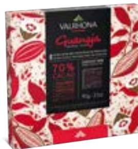
GUANAJA 70% REF. 47856 EAN : 3395328715727