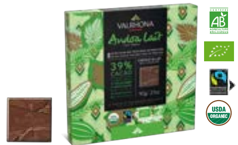
ANDOA LAIT 39% REF. 47857 EAN : 3395328715789