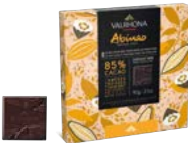
ABINAO 85% REF. 47854 EAN : 3395328715659

*Hors film plastique du coffret de regroupement *Excluding plastic film on Combination Gift Boxes